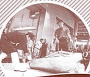
生マグロ解体ショー